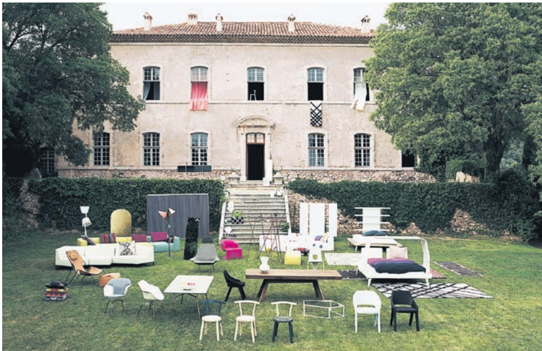
Die Kollektion 2011 von Atelier Pfister, inszeniert vor einem Schloss in der Provence.

ZÜRICH. Die neue Kollektion von Atelier Pfister machts möglich. Das bewies die Präsentation vor wenigen Wochen in Zürich. Jetzt sind die Designstücke, die das Potenzial haben, zu Klassikern zu werden, im Laden erhältlich.