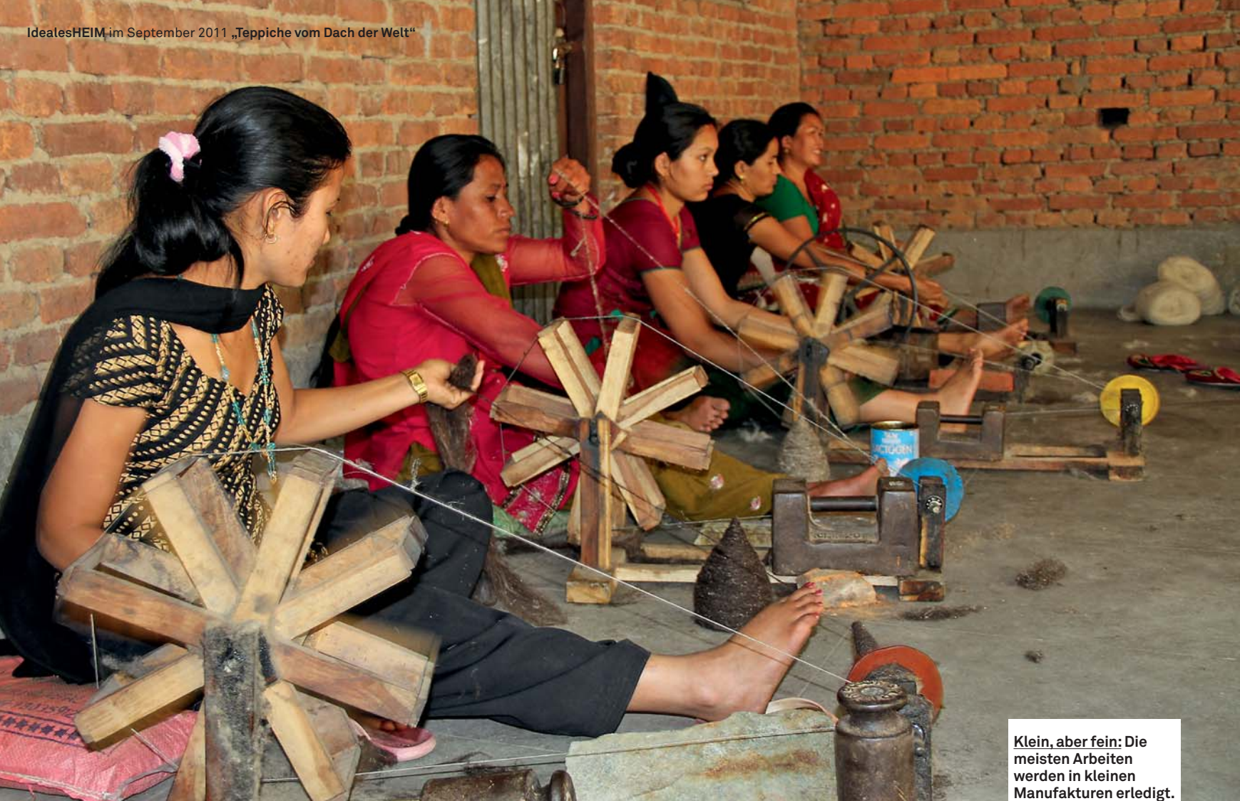
Klein, aber fein: Die meisten Arbeiten werden in kleinen Manufakturen erledigt.