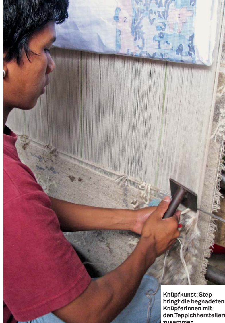
Knüpfkunst: Step bringt die begnadeten Knüpferinnen mit den Teppichherstellern zusammen.