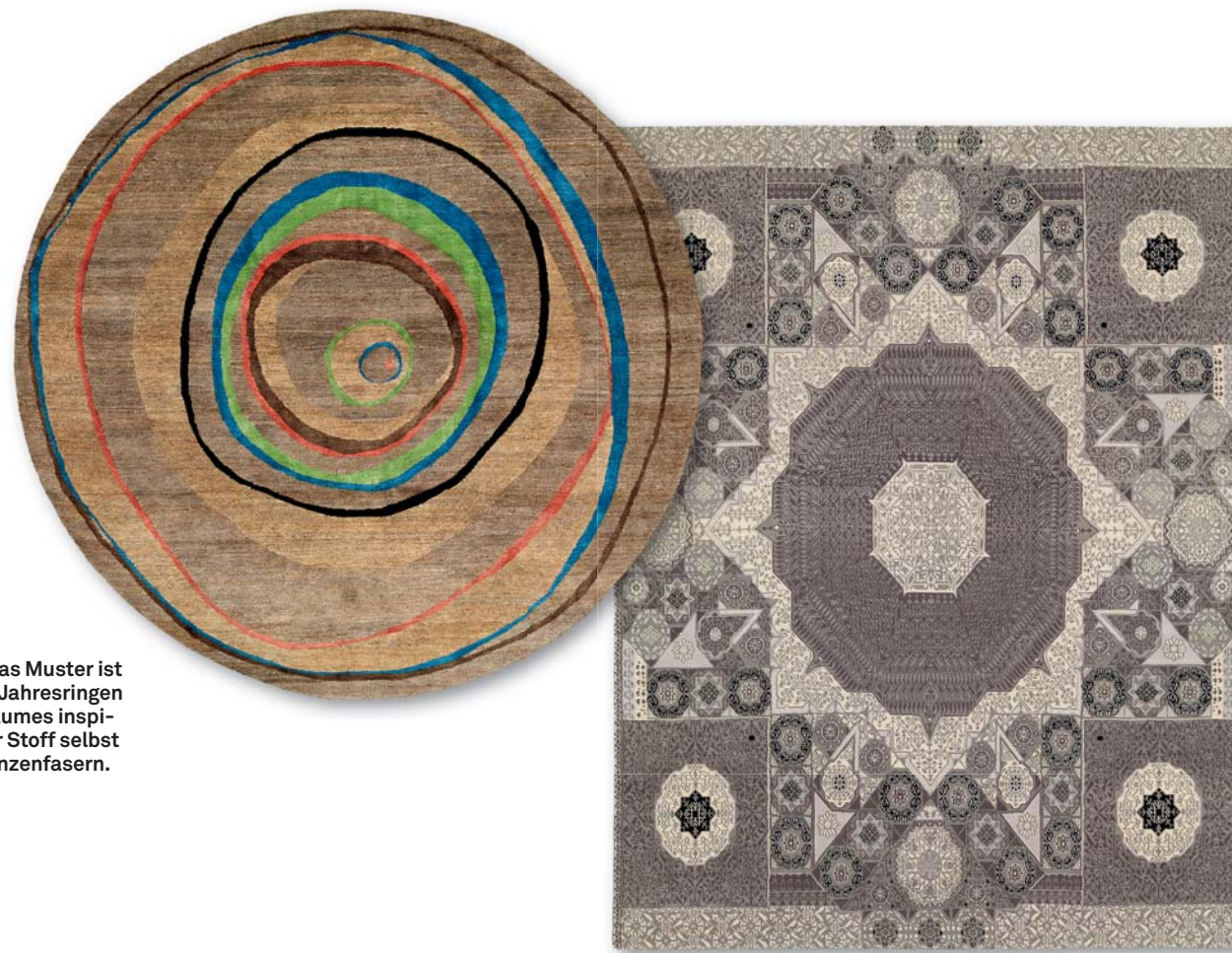
Natur: Das Muster ist von den Jahresringen eines Baumes inspiriert, der Stoff selbst aus Pflanzenfasern.