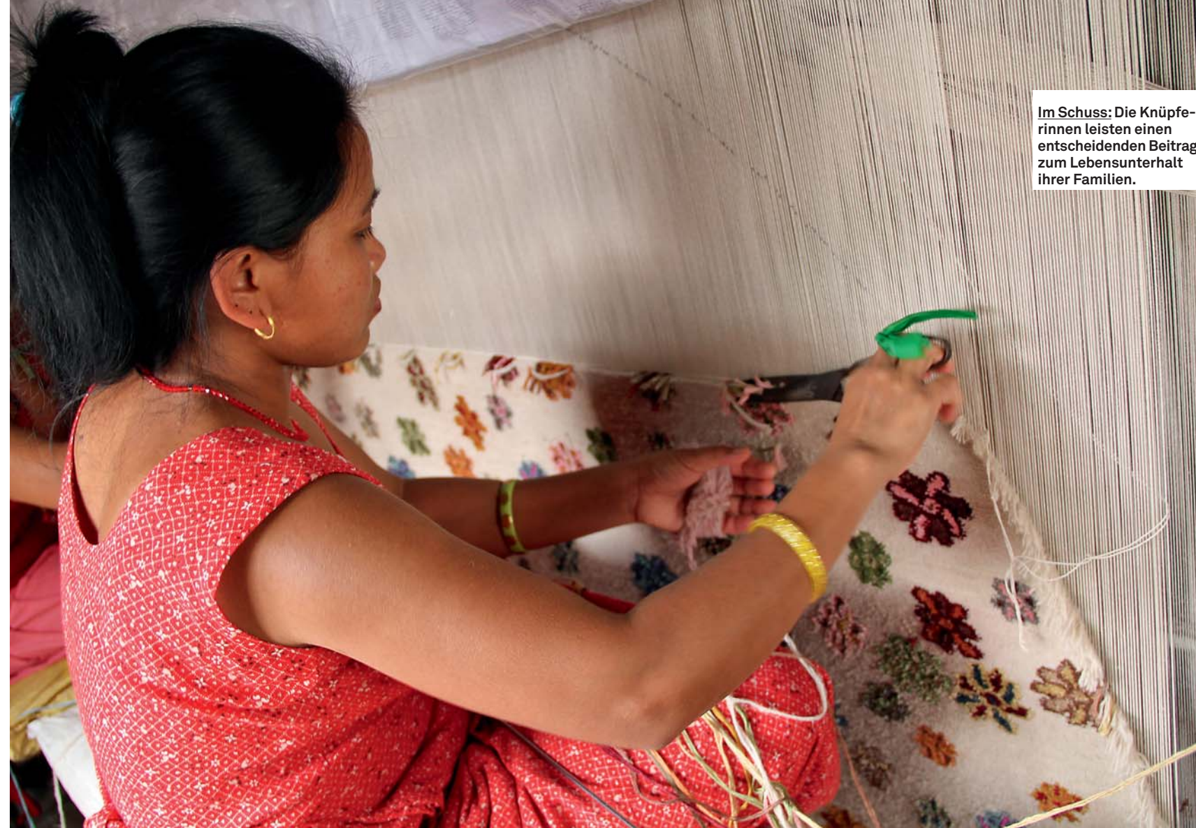
Im Schuss: Die Knüpferrinnen leisten einen entscheidenden Beitrag zum Lebensunterhalt ihrer Familien.