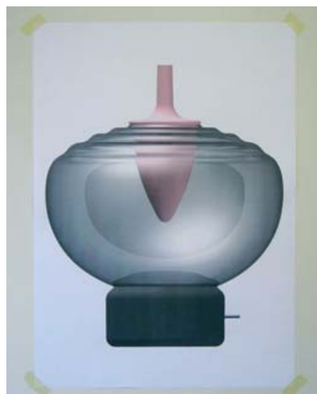
Albedo, luminaire en verre, feutre et leds. Design: Moritz Schmid pour Glassworks by Matteo Gonet, 2010.

www.moritz-schmid.com et www.matteogonet.com/