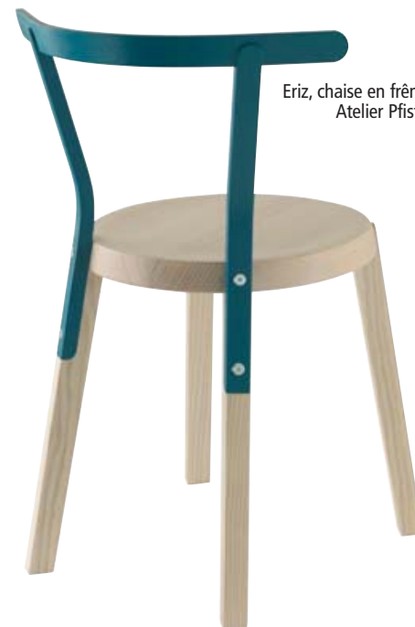
Eriz, chaise en frêne massif, Atelier Pfister, 2010.